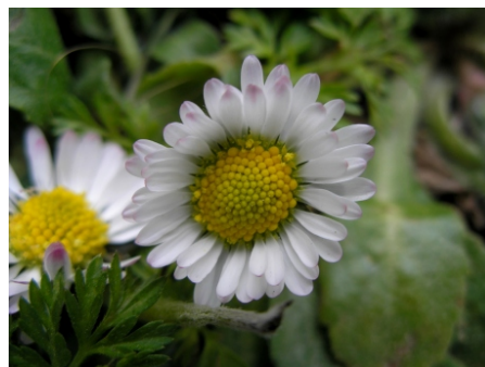
Margarita de los prados ( Bellis perennis ), Plaza de Ramón y Cajal. 23.03.07