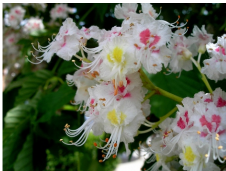
Castaño de Indias ( Aesculus hippocastanum ), Plaza de Ramón y Cajal, 16.05.07