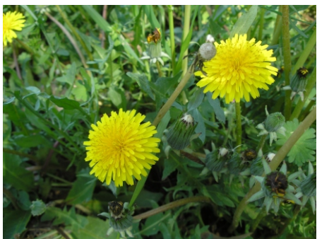
Diente de León ( Taraxacum dens-leonis ), Plaza de Ramón y Cajal, 19.04.07