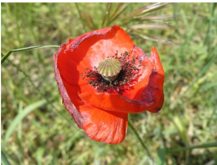
Amapola ( Papaver rhoeas ), Facultad de Farmacia - Medicina. 16.05.07

Existen cientos de especies vegetales dentro de la Ciudad Universitaria, aunque solo unas pocas llaman la atención lo suficiente como para detenerse y mirar. Entre las más llamativas destacan las especies que se muestran abajo: amapolas ( Papaver rhoeas ), viboreras ( Echium plantagineum ) y margaritas de los prados ( Bellis perennis ) entre otras muchas.