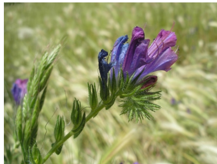
Viborera ( Echium plantagineum ), Frente al Jardín Botánico. 16.05.07.