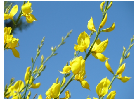
Retama de olor ( Spartium junceum ), Frente al Jardín Botánico. 10.05.07