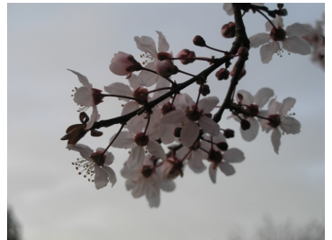
Cerezos en flor ( Prunus cerasifera ), Plaza de Ramón y Cajal, 2.03.07