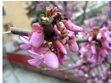
Arbol de Judea ( Cercis siliquastrum ), Plaza de Ramón y Cajal, 4.05.07