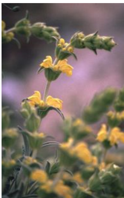
Oreja de liebre ( Phlomis lychnitis )