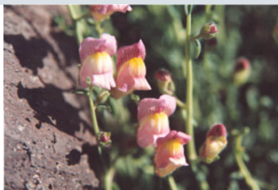
Dragoncillo del Cabo ( Antirrhinum charidemi )

Los huertos y bancales en monte alto mantienen testimonio de cultivos y arbolado de secano que alternaba con especies autóctonas.