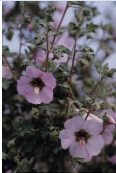
Marvarisco, Lavatera maritima

La altura y la mayor humedad, así como la diferencia de temperatura hacia valores más bajos, propician un leve descenso en la fauna de invertebrados, más patente en las zonas de cultivo intensivo y debido al fumigado agrícola, siendo en general la misma ya descrita.