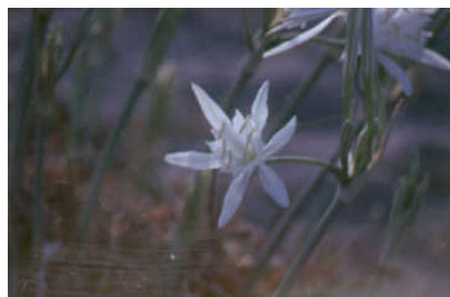
Azucena de mar ( Ziziphus lotus )

Arenas volcánicas y acantilado litoral, dunas, arenales y saladares. En la zona de influencia del oleaje viven algunos líquenes especializados y pequeñas algas. Son acantilados de pared vertical donde hallamos algún reducto vegetal en cavidades y rellanos. Es vegetación cormofítica adaptada a soportar la salinidad, como el hinojo marino ( Crithmum maritimum ) y las saladinas, ( Lycium intricatum ). En las playas, donde pueden llegar restos orgánicos con el oleaje, encontramos la oruga de mar ( Cakile marítima ). Las dunas embrionarias del litoral, albergan una vegetación escasa y muy pobre en gramíneas, entre las que domina la Algodonosa compuesta ( Otanthus Maritimus ) y el Elymus Factus . En la banda interior siguiente, la de las dunas móviles, podemos ver gramíneas como el Barrón ( Ammophila arenaira arundinacea ). Aún más alejados del agua, las dunas semifijas, con la presencia de especies camefíticas, como la Bolina o Pegamoscas ( Ononis natrix ramosissima ). En las dunas fijas, hallamos tarayales de Tomarix boveana y especies halófilas como la Limonium