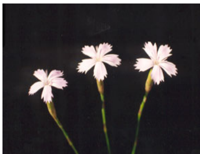
Clavellina del Cabo