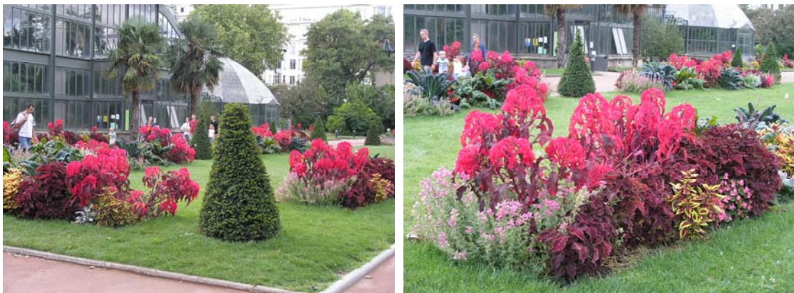
Jardines frente a los invernaderos

En cooperación con otros organismos (asociaciones, conservatorios botánicos), el Jardín Botánico participa activamente en la conservación de especies raras y amenazadas de la región y del mundo entero. Además, asegura el ordenamiento taxonómico de sus numerosas especies vegetales, elabora asesorías botánicas y hortícolas y desarrolla técnicas de cultivos adaptadas para las especies raras.