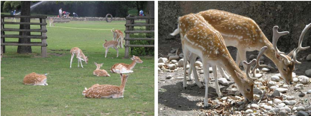
Ciervos en el Parque de la Tête d'Or (que alberga el Jardín Botánico)