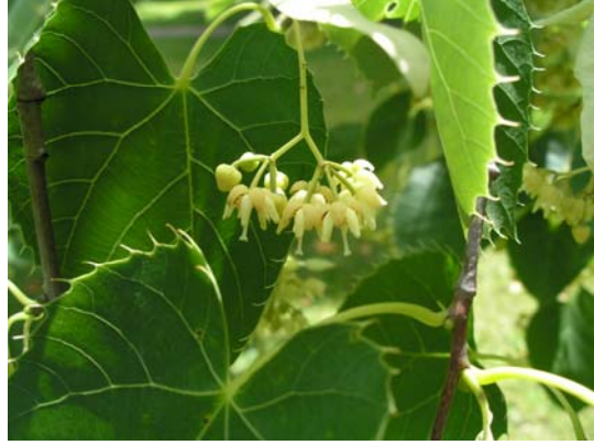
Tilia henryana (tilo)