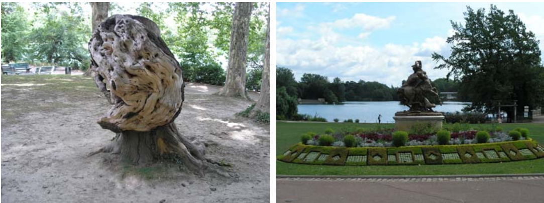
Imágenes del Parque de la Tête d'Or