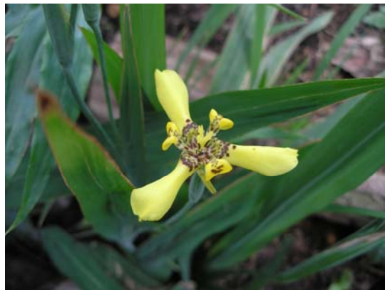
Arum sp. y Trimezia steyermarkii