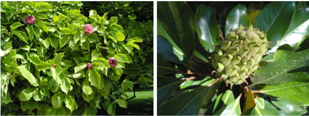
Magnolia (flor y fruto)