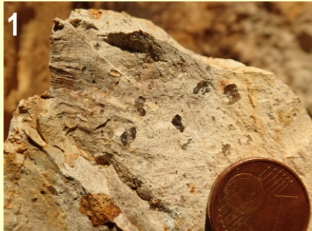
Pórfido cuarcífero con abundantes fenocristales de cuarzo translúcidos.