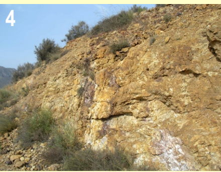
Dacitas porfíricas muy alteradas y fracturadas. En primer plano, falla normal con escalones y fuerte alteración caolinitica. También se observan venas de goethita y abundante jarosita.