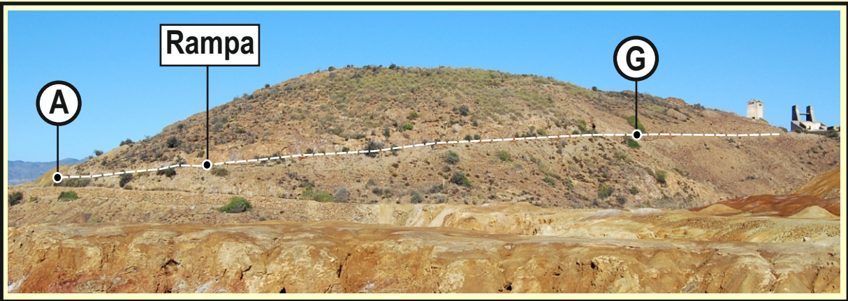
Mazarrón sector Perules